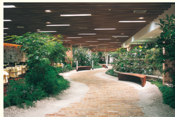
↑10階=ダイニングパーク横浜

また、2・3階はラグジュアリーブランドのリニューアルにより、メンズ & レディースを融合した売場が充実。落ち着いた空間でゆっくりとお買い物を楽しんでいただけます。