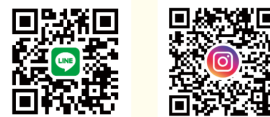
↑横浜ポルタ公式SNSはこちら!