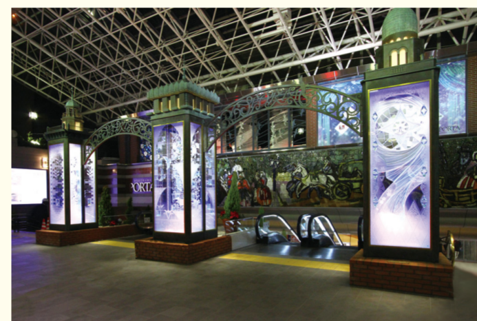
↑メインモニュメントのPORTA横浜三塔物語

散策やショッピングをお楽しみの際に、バラエティに富んだカフェやレストランで一息ついてはいかがでしょうか?